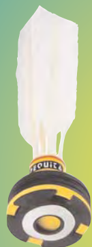
Compétition Jeu rapide / fast play