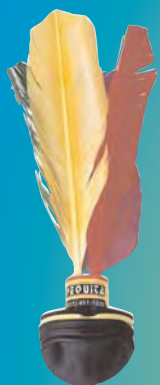
Rio Plage Jeu lent

Peteca is a giant shuttlecock played over a volleyball net with the palm of the hand only.